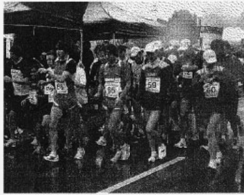
La partenza del Trofeo Frigerio 2010 dal Corso Italia, con molti atleti cinesi

L'aspetto più attrattivo sicuramente è dato dal confronto fra due scuole che da anni dominano le scene, quelle di Italia e Cina. L'Italia schiera tutti nomi nuovi, ma con presenze già